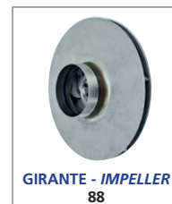
GIRANTE - IMPELLER 88