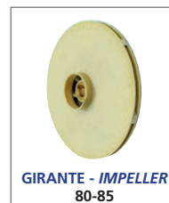
GIRANTE - IMPELLER 80-85